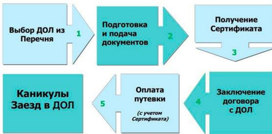
Рисунок 1. Порядок приобретения путевок в ДОЛ в Санкт-Петербурге.

Порядок приобретения путевок в детские оздоровительные лагеря (далее – ДОЛ) для детей работающих граждан представлен на рис. 1.