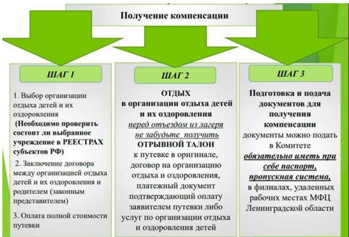
Рисунок 2. Порядок приобретения путевок в ДОЛ В Ленинградской области.

Порядок приобретения путевок в ДОЛ и получение компенсации представлен на рис. 2.